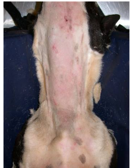
Непроникаюча кусана рана, собака

Перед початком радикального лікування рани тварину слід ретельно оглянути та стабілізувати. Перш ніж можна буде прийняти рішення щодо відновлення рани, її слід розширити хірургічним шляхом настільки, наскільки це необхідно, щоб забезпечити можливість ретельного огляду та визначення її розміру. Після відповідної оцінки можна проводити санацію. Якщо не виконується санація рани єдиним блоком, повне закриття рани зазвичай не